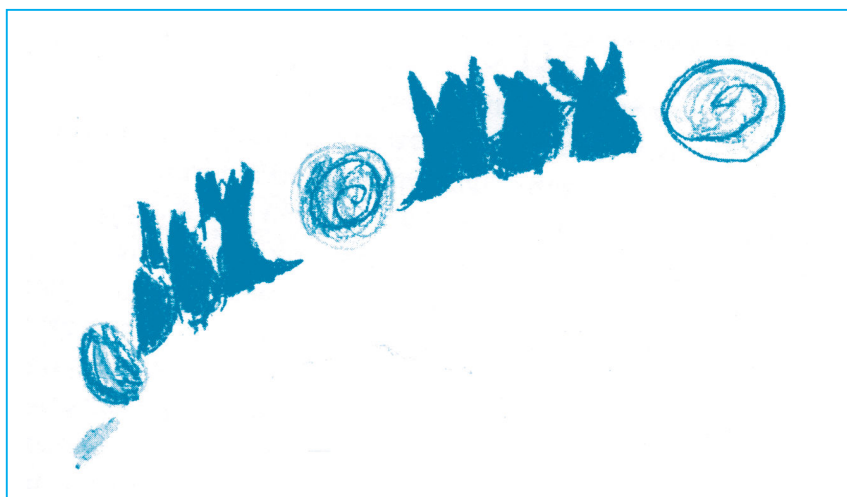
הצורה המוזיקלית בציורי הילדים בשעת האזנה לנגינה (גילאי 7-12)